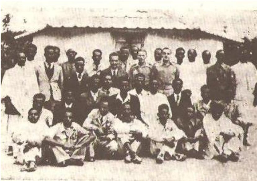
ኣብ'ዚ ስእሊ'ዚ እቶም ብመጀመርያ እዋን እምነ መሠረት ትምህርቲ ንምንባር ተመሪጹም እተዋፈሩ ፲፱ መምህራን ይርአዩ።

ከምኡ እውን ኣብ ቅድሚ ተመሃሮእም ብሽመይ ዝበለ መልክዕ ኪቐርቡ ከም ዝነበሮምን ከም ዝግብእ ምን ዝሕብር ኣገባብ ኣመሃህራ ሓንጺጾም ብምዝታይ ተሰማምዑ።