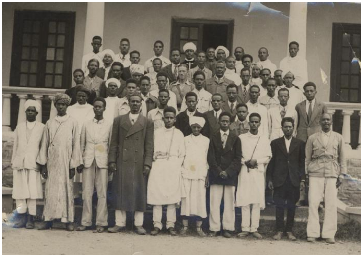
— አብዚ ስእሊ'ዚ እቶም ብ፲፱፻፵፬ ዓ-ም-ፈ- ንም ምህርና ተዳልዮም እተዋፈሩን እቶም ቅድሚያም

ትምህርታዊ ፍሬ ናይቶም ብወርሒ ጥሪ ፲፱፻፵፫ ዓ-ም-ፈ- እተዋፈሩ መምህራን ብምዕዛብ ከአ ብዙ ሓት ካልኣት ጌና ቤት ትምህርቲ ርእየን ዘይፈልግ ዓድታት፡ አብ ዓዓደን አብያተ ትምህርቲ ኪኸፍቱለን ሓተታ ። ስለ'ዚ ከአ ብኡን ብኡን ጽጅ አብያተ ትም ህርቲ ተኸፍታ ። ዓጅ መምህራን ከአ ተዘርግሎ ። አብ መላእ ኤርትራ ድማ ንመጀመርያ እዋን ፪ ሺሕን ፬፻ ተመሃሮ ተመዘገቡ ።